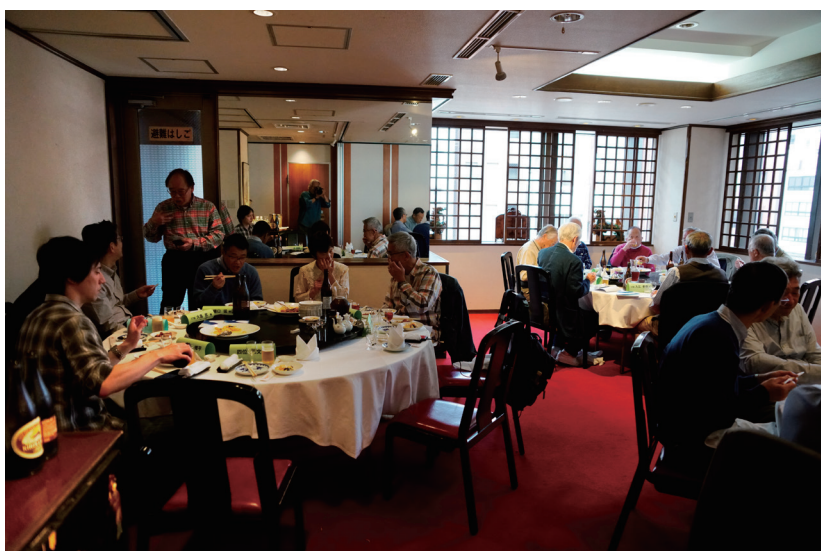
会場の「新橋亭」(東京)